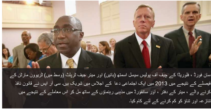
سان فورڈ، فلوریڈا کے چیف آف پولیس سیمبل اسمتھ (بائیں) اور میئر جیف ٹریٹ (وسط میں) ٹریبون مارٹن کے فیصلے کے نتیجے میں 2013 میں ایک اجتماعی دعا کے اجلاس میں شریک ہیں۔ سی آر ایس نے قانون نافذ کرنے والے، میئر کے دفتر، اور سانفورڈ میں مذہبی رہنماؤں کے ساتھ مل کر اس معاملے کے نتیجے میں تنازعہ اور تناؤ کو کم کرنے کے لئے کام کیا۔

سی آر ایس عوامی پروگراموں کی منصوبہ بندی کرنے والے منتظمین کیلئے ہنگامی منصوبہ بندی اور