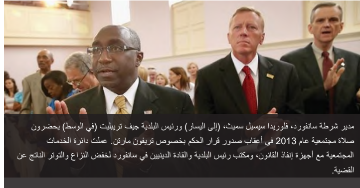
مدير شرطة سانفورد، فلوريدا سيسيل سميث، (إلى اليسار) ورئيس البلدية جيف تريبلت (في الوسط) يحضرون صلاة مجتمعية عام 2013 في أعقاب صدور قرار الحكم بخصوص تريفون مارتن. عملت دائرة الخدمات المجتمعية مع أجهزة إنفاذ القانون، ومكتب رئيس البلدية والقادة الدينيين في سانفورد لخفض النزاع والتوتر الناتج عن القضية.

والقادة الدينيين وغيرهم من ذوي الخبرة لتثقيف